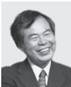
基調提案講師・パネリスト