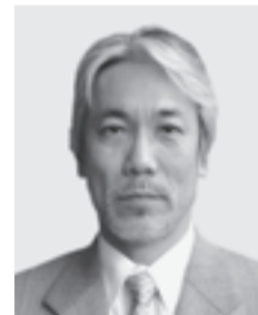
コーディネーター

関西広域連合本部事務局長（兵庫県参事） 1953年生まれ。 京都大学法学部卒業。 1978年兵庫県入庁。政策室課長、県民政策部政策局長、但馬県民局長等を経て現職。 関西広域連合の設立（平成22年12月1日）に携わる。